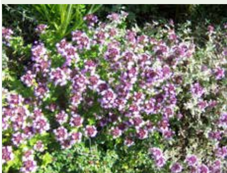
Verwöhnaromen Petra Ehrentraut