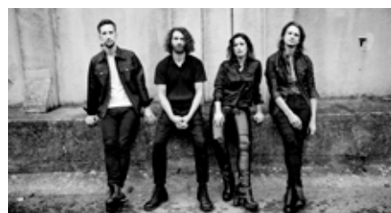
Silbermond-Auf den Sommer 2024 Pressebild