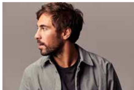
Max Giesinger