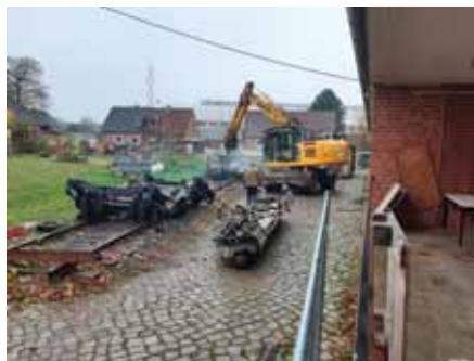
Nur noch die Drehgestelle sind über