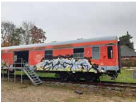
1. Klasse Nichtraucher