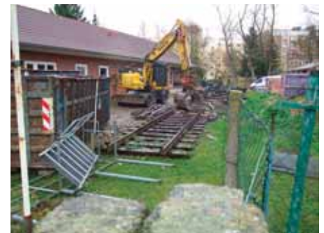
Als letztes sind die Gleise dran